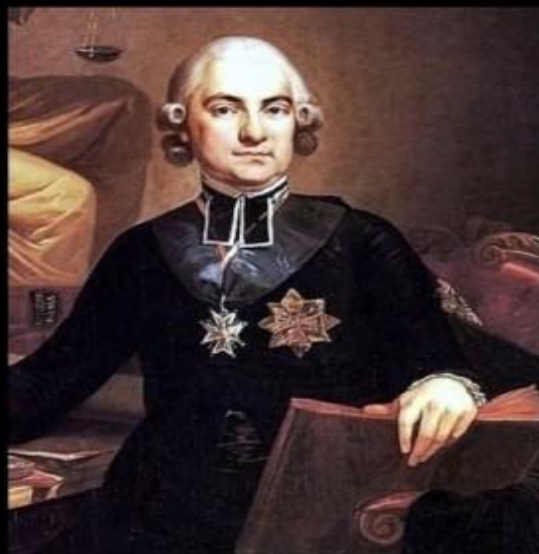
KSIĄDZ HUGO KOŁŁĄTAJ