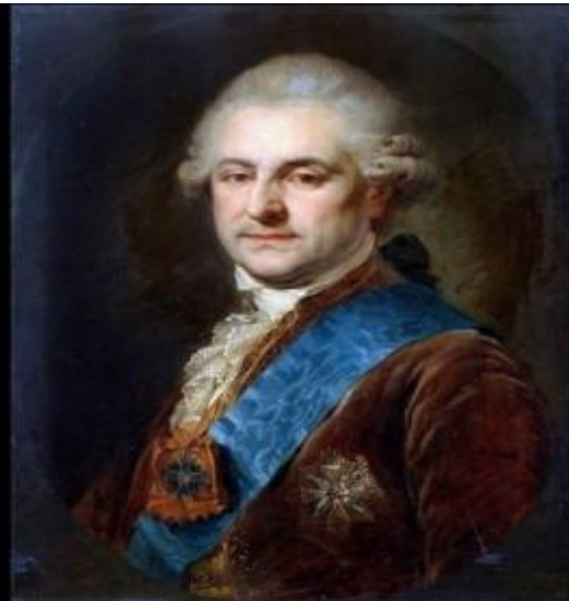
KRÓL STANISŁAW AUGUST